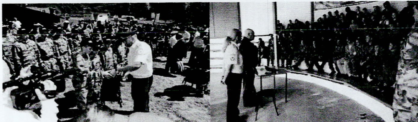
Вручение наград и памятных подарков наиболее отличившимся ребятам

Специфической чертой смены «Патриот» является задействование в ее работе всех заинтересованных субъектов профилактики, общественных организаций, волонтеров. Фактически каждый из дней смены проходит под эгидой одного из профильных министерств и ведомств. Организаторы стараются наполнить его яркими, познавательными и запоминающимися мероприятиями.