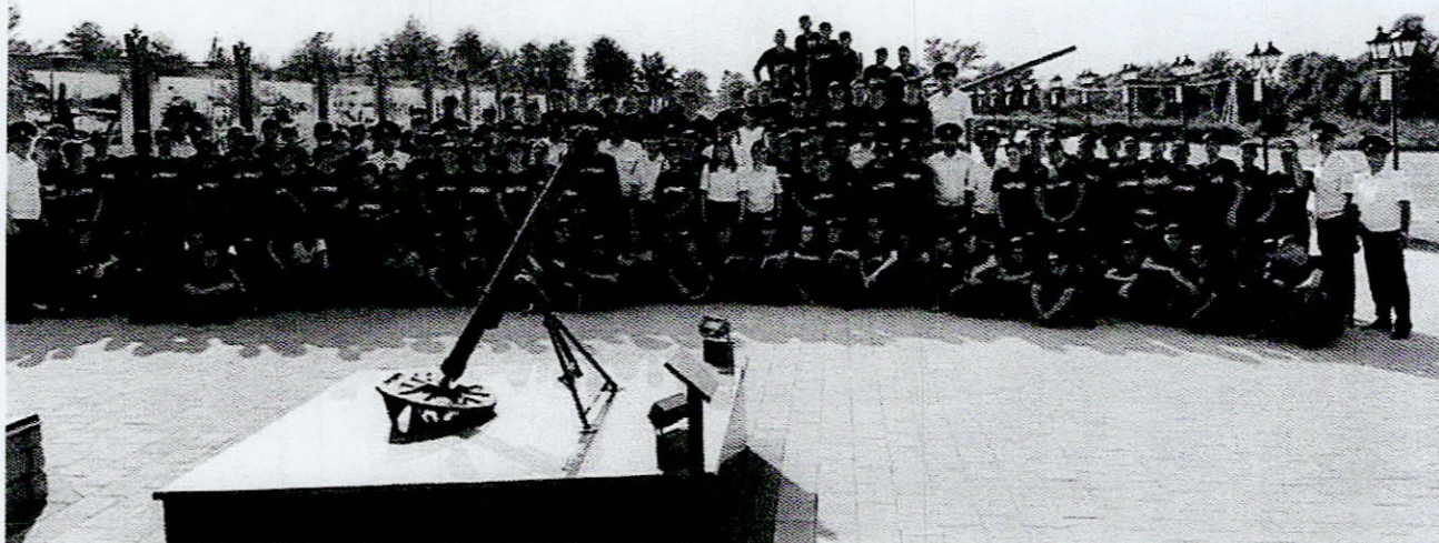
Участники профильной смены «Патриот» на экскурсии в мемориальном комплексе «Барбашово поле»

Средства на данное мероприятие заложены в подпрограмму «Социальная реабилитация детей, находящихся в конфликте с законом (совершивших правонарушения и преступления), профилактика безнадзорности и беспризорности детей, преступности несовершеннолетних, в том числе повторной» государственной программы «Социальное развитие Республики Северная Осетия-Алания» на 2016–2024 годы» 1 .